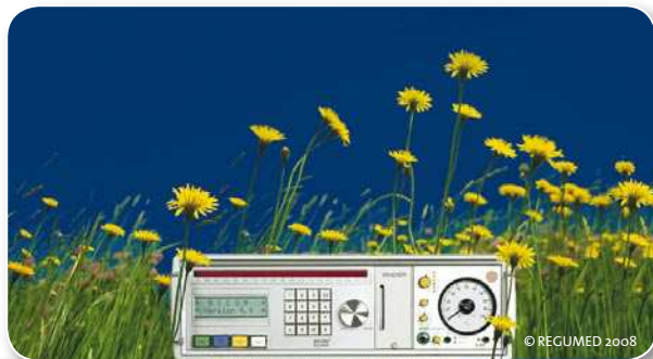
Natur und Technik zum Wohl des Patienten

Neue wirkungsvolle und zugleich schonende Ansätze in Diagnose und Therapie sind daher gefragt.